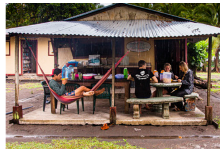
Auch in der Regenzeit gemütlich: Die Küche, die bei Biosphere Expeditions grundsätzlich nur tropisch-vegetarische Kost anbietet