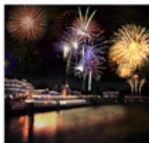
Reise Ideen für Sylvester