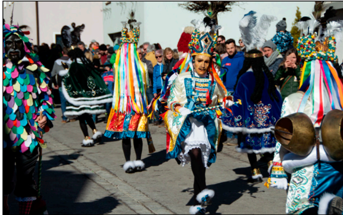
Fasching, Fastnacht, Karneval Unterwegs zu Masken und Larven