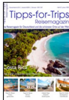
Lifestyle Elektrisch unterwegs

Heft 2.2020 ab 20. Januar 2020 bei Ihrem Händler oder bestellen unter: https://shop.tipps-media.eu/Tipps-for-Trips-Reisemagazin Unsere nächsten Titel-Themen: Heft 3.2020 Florida Heft 4.2020: Japan