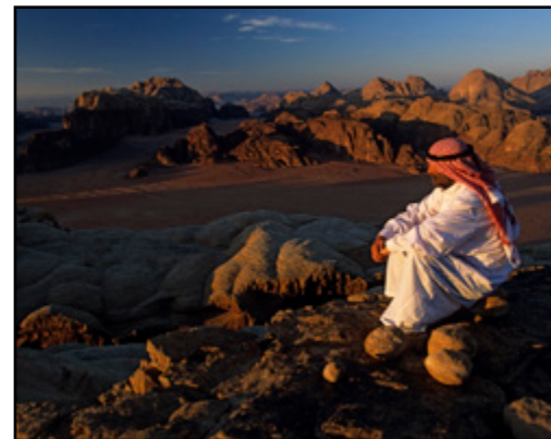
Jordanien Königreich im Nahen Osten