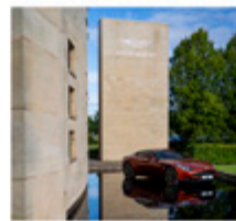
Lifestyle Werkbesuch bei Aston Martin