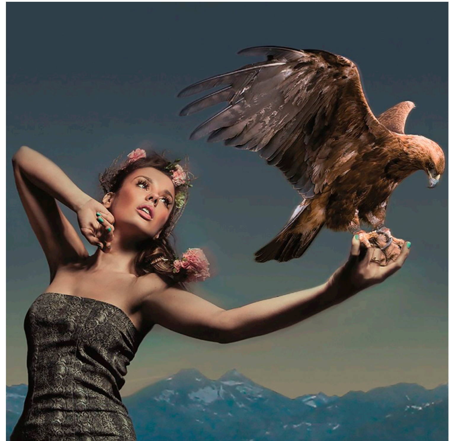
Hotel Posthotel Achenkirch

Berg-Erklimmer und Natur-Stauner: Im Zillertal eröffnet ab Okt 2019