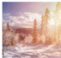
Reise in den Winter