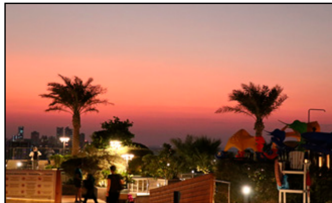
Bahrain blüht auf - das erstaunliche Königreich im persischen Golf