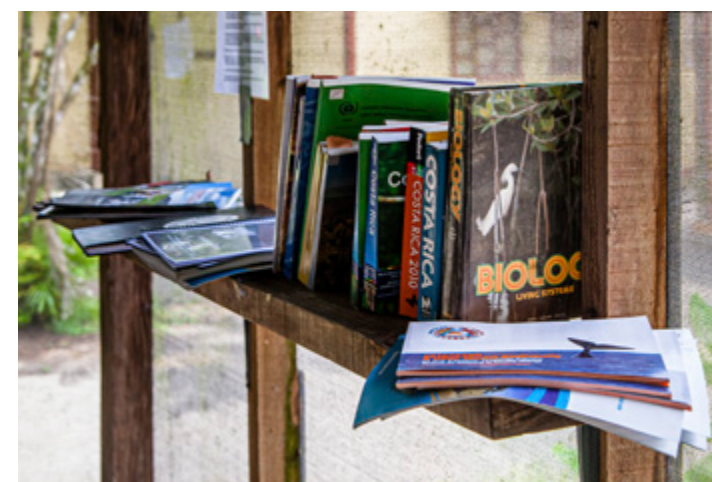
Die Präsenzbibliothek mit Wissenschafts- und Reiselektüre steht im Speise- und Tagungsraum

Die geheimnisvollen Lederschildkröten sind riesig und nur schwer zu Gesicht zu bekommen. Die bis zu 500 kg schweren Kolosse durchqueren mehrere Ozeane. Aber zur Fortpflanzung kommen sie im Schutz der Nacht immer wieder an den Strand zurück, an dem sie selbst aus dem Ei geschlüpft sind. Und das seit Urzeiten, denn lange vor dem Auftreten der ersten Dinosaurier haben sie das schon so gemacht.