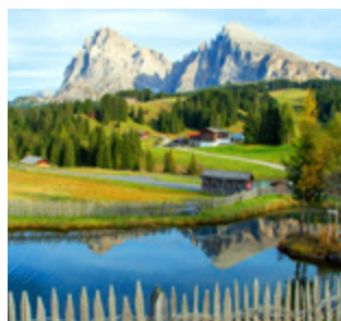
Reise Auf der Seiseralp