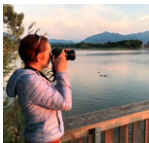
Reise Fotosafari im Chiemgau